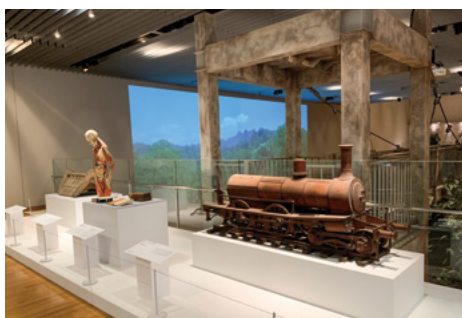
京都大学創立125周年記念事業「創造と越境の125年」展