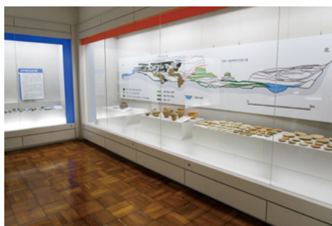
文化財発掘Ⅶ「埋もれた古道を探る」展