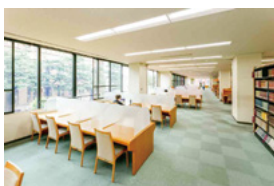
閲覧室 附属図書館の閲覧室にある個人用の閲覧・学習席約 1,000 席が利用できます。