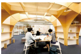
ラーニング・コモンズ 附属図書館にあり、グループワークや発表練習等、会話しながら学習できるスペースです。